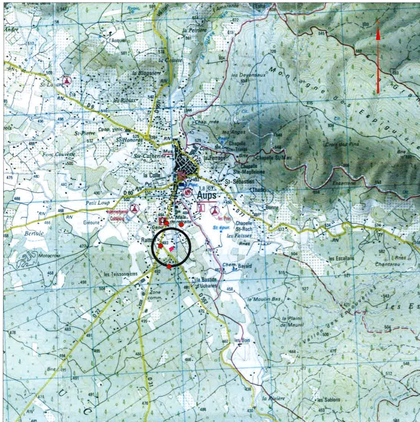
PLAN DE SITUATION - 1/25000

PLAN LOCAL D'URBANISME: Zone Uc EMPLACEMENT RESERVE: E.R n° 14, Elargissement du chemin du stade (Largeur emprise : 8m) PLAN DE PREVENTION DES RISQUES D'INONDATION: Non Concerné DEMANDE DE DEFRICHEMENT: Non Concerné PROTECTION DU PATRIMOINE: Non Concerné NATURA 2000 : Non Concerné